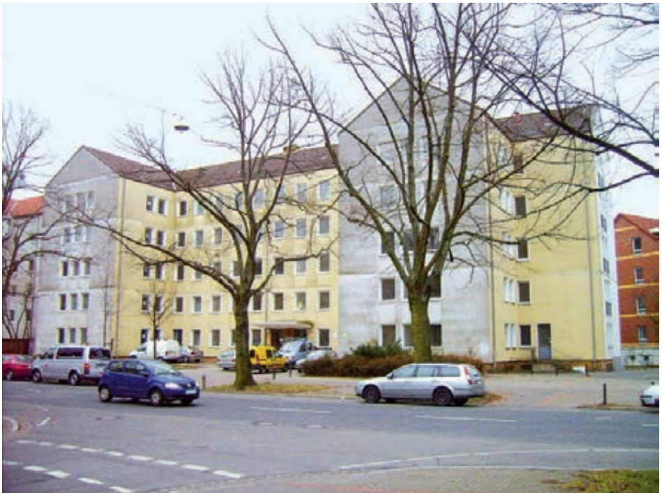
Wohnheim, Hannover, Haltenhoffstraße