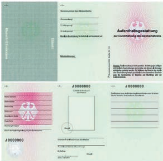
Aufenthaltsgestattung (Bundesgesetzblatt 2004, I S. 3024/3025)

Häufig melden sich minderjährige Flüchtlinge, die ohne Eltern oder Erziehungsbeauftragte nach Deutschland gekommen sind. Diese werden dann in Obhut genommen und kommen nicht in eine Erstaufnahmeeinrichtung für Asylbewerber, sondern in eine Jugendhilfeeinrichtung. Das zuständige Jugendamt kann ein Altersfestsetzungsverfahren einleiten, wenn Zweifel an der Minderjährigkeit bestehen. Asylmündigkeit beginnt mit dem 16. Geburtstag, vorher wird vom Jugendamt ein Vormund bestellt.