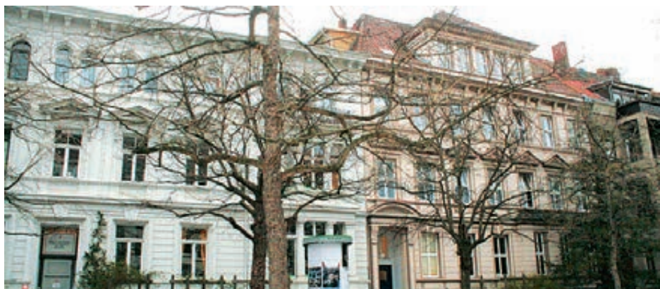
Wohnheim der Caritas in Hannover; Rumannstraße

Die aus den EAEs verteilten Flüchtlinge dürfen sich ohne gesonderte Genehmigung durch die Ausländerbehörde in ganz Niedersachsen und Bremen „bewegen“. Diese sogenannte Residenzpflicht (Einschränkung der Reisefreiheit) wird in Kürze mit Ausnahme der Zeit in einer EAE aufgehoben werden. Es darf Flüchtlingen dann nur noch in ganz wenigen Ausnahmen die Reisefreiheit in Deutschland verweigert werden. Allerdings wird auch zukünftig den Flüchtlingen ein fester Wohnort zugewiesen, und nur dort erhalten sie Sozialleistungen.