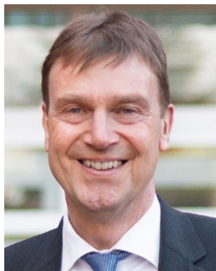
Landrat Kai-Uwe Bielefeld